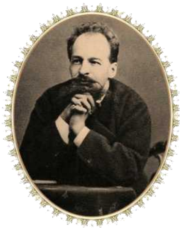
Виктор Александрович Гартман - выдающийся русский архитектор и художник, друг Мусоргского