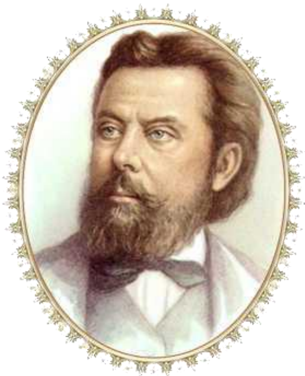
Модест Петрович Мусоргский – великий русский композитор XIX века.

М. Мусоргский фортепианный цикл «Картинки с выставки»